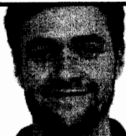
Shkruan: Steven Bardsli ("Stars and Stripes")